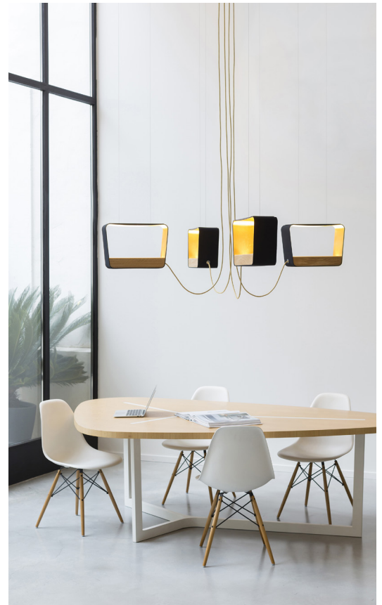
Eau de lumière